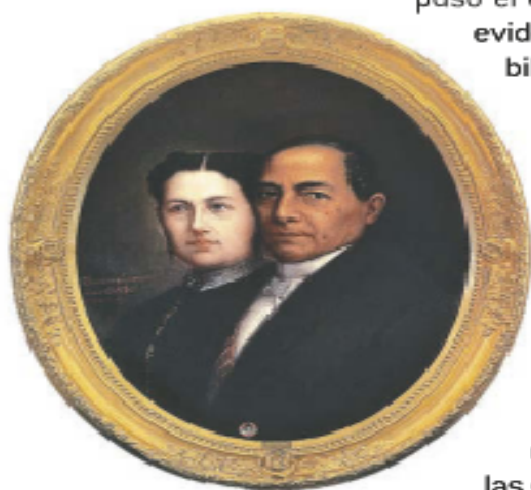
Figura 3.25. Benito Juárez y su esposa Margarita Maza de Juárez; óleo de Escudero y Espronceda (1890).

Las costosas experiencias que había sufrido México a lo largo del siglo XIX: las invasiones extranjeras, las pérdidas territoriales y el enorme costo económico, político y social que supuso el enfrentamiento entre el proyecto liberal y el proyecto conservador, hicieron evidente la necesidad de integrar un proyecto nacional que favoreciera la estabilidad política, social y el crecimiento económico de México. Ese proyecto fue consolidado por los gobiernos liberales entre 1867 y 1876 durante la etapa conocida como restauración de la República.