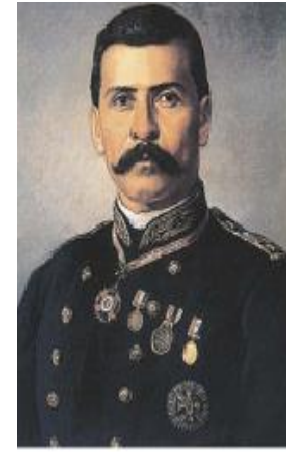
Figura 3.26. En el Plan de Tuxtepec, Porfirio Díaz enarboló la bandera de la no reelección. Tiempo después abandonó ese principio para perpetuarse en el poder.

Con habilidad, Díaz logró debilitar a sus enemigos políticos enfrentándolos entre sí o les concedió prerrogativas para mantenerlos contentos. Sostuvo el apoyo a las Leyes de Reforma, para mantener la simpatía de los liberales, pero concedió ciertas licencias a la Iglesia y permitió a esa institución recobrar parte de su fuerza política y económica, lo que le valió la simpatía de los conservadores. Por otro lado, reprimió de manera violenta a los grupos que no apoyaron sus decisiones y que intentaron sublevarse; de Porfirio Díaz es la famosa orden: "mátalos en caliente", dada al gobernador de Veracruz para acabar con una conspiración antiporfirista que simpatizaba con Lerdo de Tejada. Además, supo validar la fuerza de los principales caciques regionales, nombrándolos jefes políticos y otorgándoles ilimitado poder en sus regiones [figura 3.27].